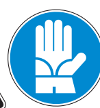
Protección obligatoria de las manos