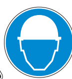
Protección obligatoria de la cabeza